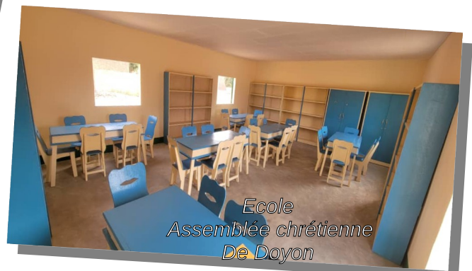
Ecole Assemblée chrétienne De Doyon