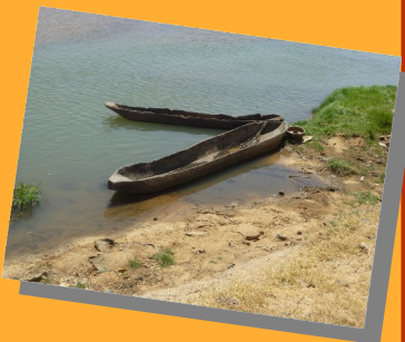
Au bord du Logone

Poitiers-Moundou, Association loi 1901 Jumelage-Coopération entre la ville de Poitiers et la ville de Moundou