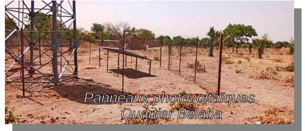
Panneaux photovoltaïques Quartier Belaba