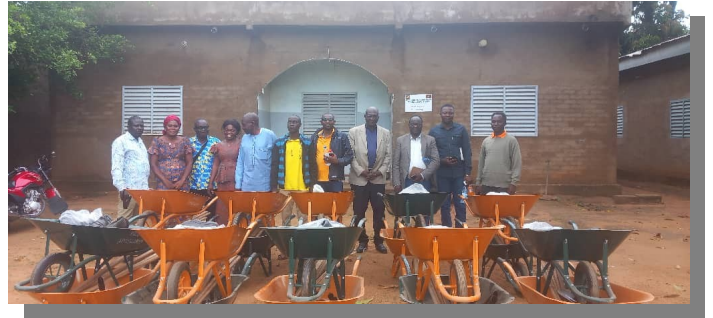
Remise devant un des bâtiments du Complexe de l'AAMP