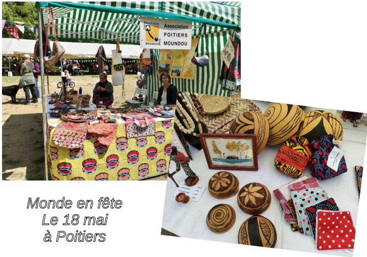
Monde en fête Le 18 mai à Poitiers