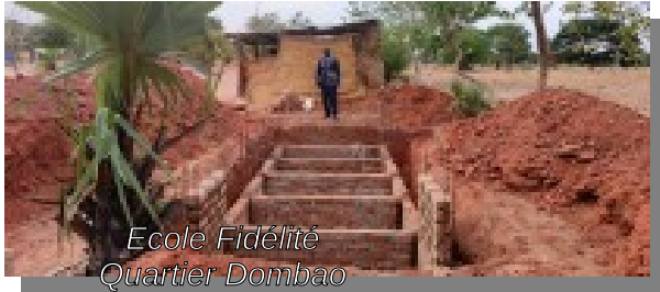
Ecole Fidélité Quartier Dombao