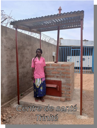
Centre de santé Trinité