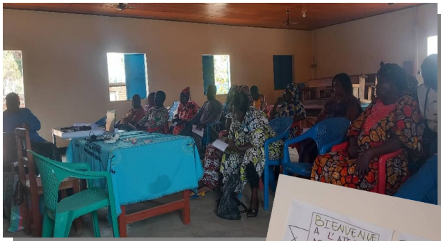
Formation informatique organisée par l'AAMP