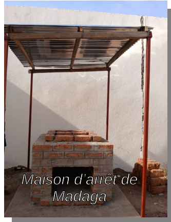
Maison d'arrêt de Madaga