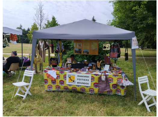
Fête des Trois Cités Le 14 juin à Poitiers