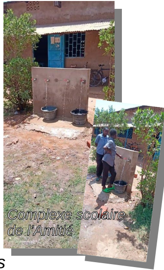
Complexe scolaire de l'Amitié