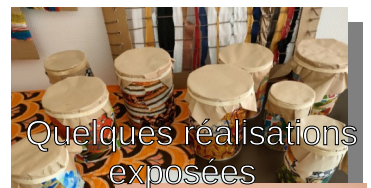
Quelques réalisations exposées

Participation au projet sur l'Afrique avec les résidents du Centre Médico-Social de Biard