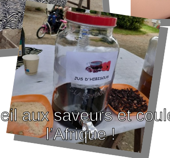
Un accueil aux saveurs et couleurs de l'Afrique !