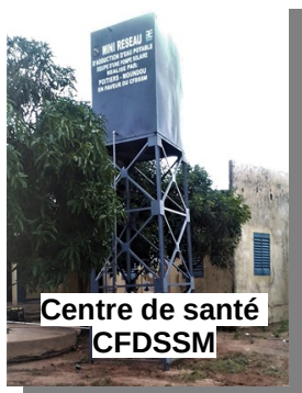
Centre de santé CFDSSM