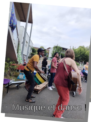
Musique et danse !