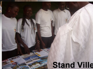
Stand Ville de Poitiers

Organisée du 23 au 25 novembre en partenariat avec ADIFLOR et l'AAMP dans le cadre du projet de création d'un réseau de Petites Maisons des Livres dans les écoles élémentaires: