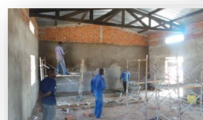
PML Ecole des Cadres