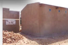
PML Ecole Lac Taba